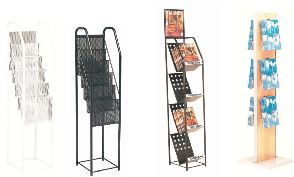
PD01 B 76,00 € ht