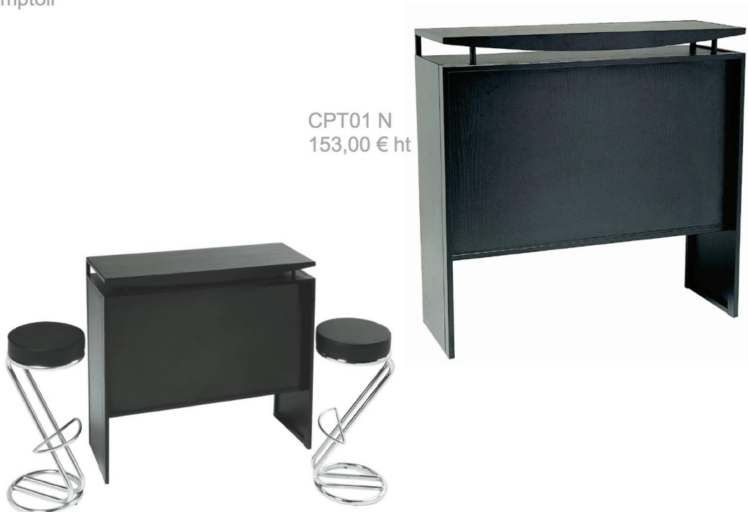
CPT01 N 153,00 € ht