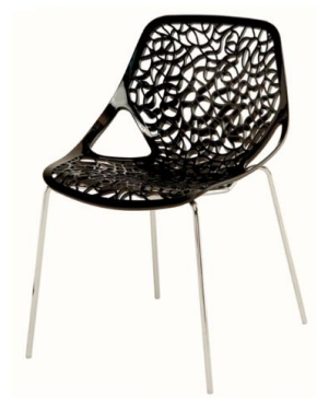
C01 N 65,00 € ht