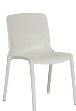
C03 B 60,00 € ht