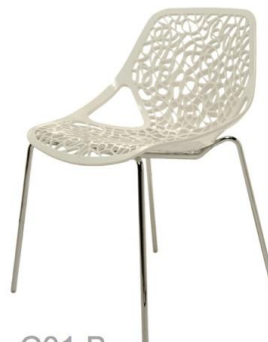
C01 B 65,00 € ht