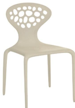
C02 B 54,00 € ht